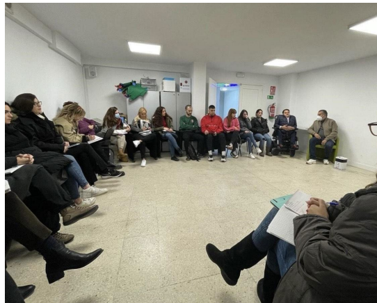
Primera reunión de equipo. 11 de enero 2023.

La primera buena noticia del 2023 fue la concesión del Proyecto de Ampliación Tecnológica, que nos permitirá ampliar nuestro rango de alcance mucho más de lo esperado. Además, este año contamos también con un crecimiento de personal en los equipos, facilitando así mayor capacidad de trabajo.