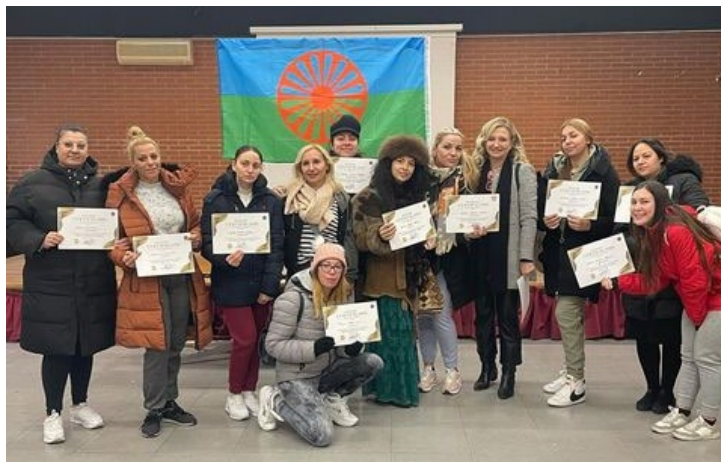
Entrega de diplomas en Pan Bendito. 24 de enero 2023.